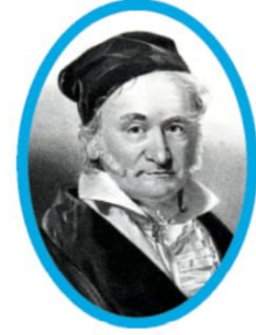
Carl Friedrich Gauss (C.E.1777 – C.E.1855)

An equivalent version of Theorem 1.2 was probably first recorded as Proposition 14 of Book IX in Euclid's Elements , before it came to be known as the Fundamental Theorem of Arithmetic . However, the first correct proof was given by Carl Friedrich Gauss in his Disquisitiones Arithmeticae . Carl Friedrich Gauss is often referred to as the 'Prince of Mathematicians' and is considered one of the three greatest mathematicians of all time, along with Archimedes and Newton . He has made fundamental contributions to both mathematics and science.