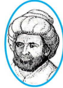
Muhammad ibn Musa al-Khwarizmi (C.E. 780 - C.E.850)

A lemma is a proven statement used for proving another statement.