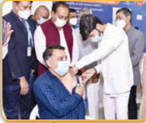
મંત્રી શ્રી ધર્મેન્દ્રસિંહ જાડેજા - જામનગર