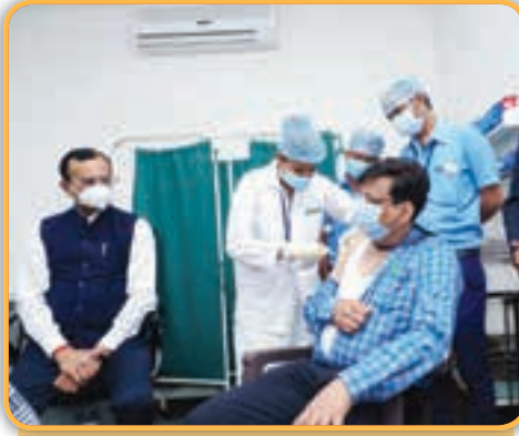
મંત્રી શ્રી પ્રદીપસિંહ જાડેજા - દાહોદ