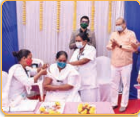
મંત્રી શ્રી જયદ્રથસિંહજી પરમાર - છોટાઉદેપુર