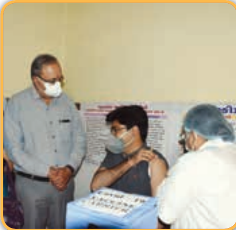
મંત્રી શ્રી સૌરભભાઈ પટેલ - બોટાદ